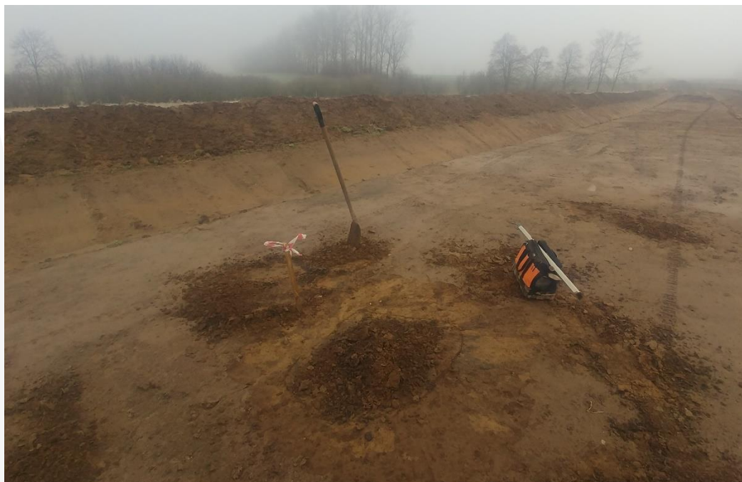
Fot. 7. Odkryte obiekty oznakowane i wstępnie zabezpieczone.