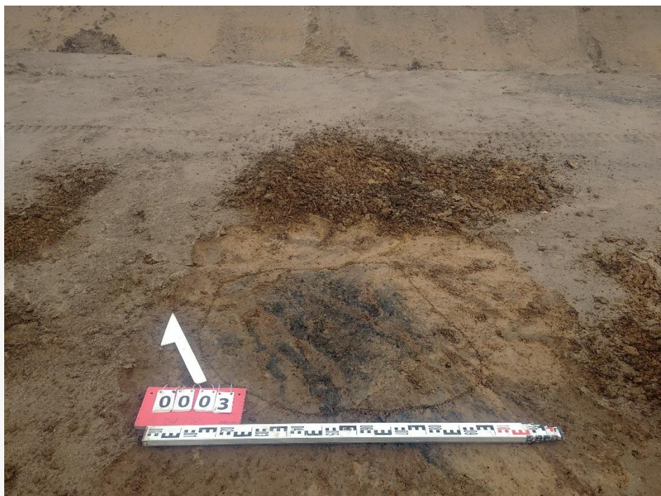
Fot. 3 Obiekt archeologiczny nr 2.