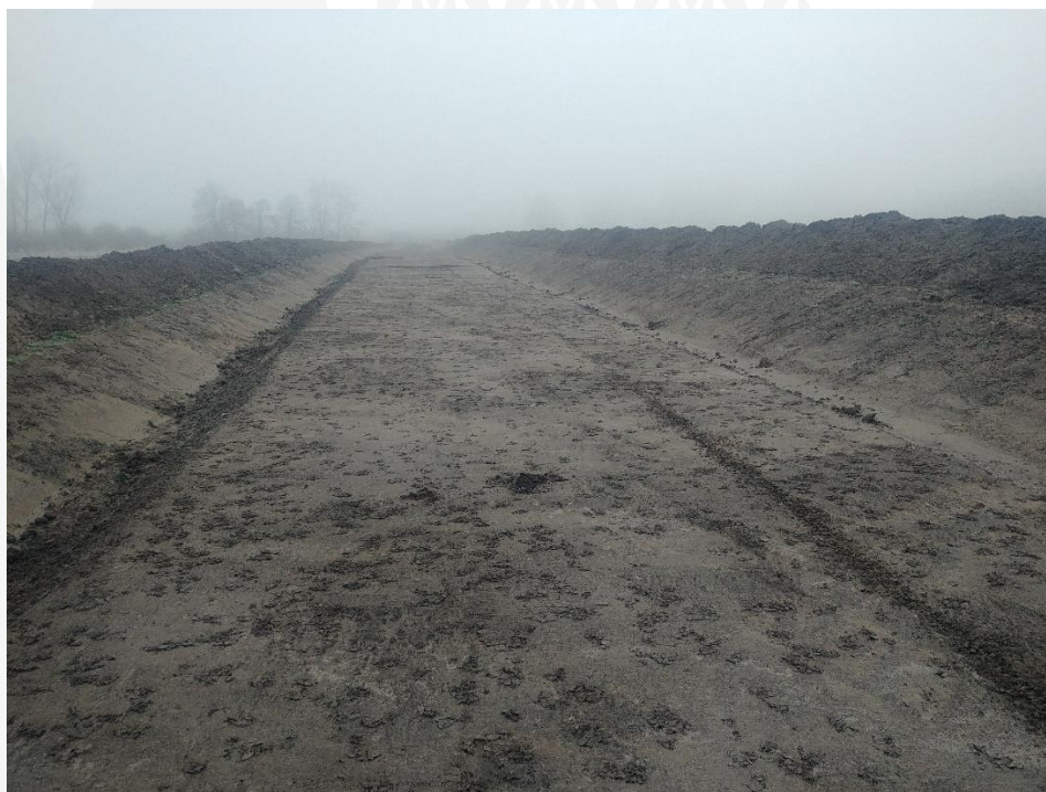
Fot. 1 Obszar odhumusowania.