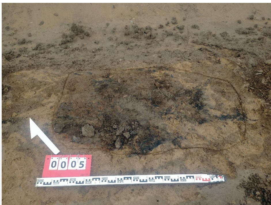
Fot. 5 Obiekt archeologiczny nr 4.